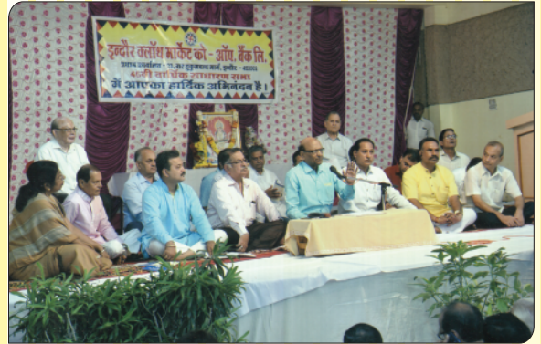
बैंक की 46 वीं वार्षिक साधारण सभा को संबोधित करते हुए अध्यक्ष, उपाध्यक्ष एवं संचालकगण