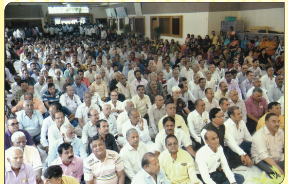
बैंक की 46 वीं वार्षिक साधारण सभा में उपस्थित सदस्य महानुभाव