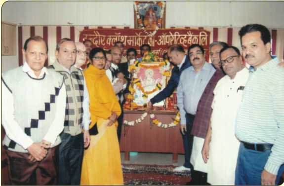
बैंक के स्थापना दिवस पर दीप प्रज्ज्वलित करते हुए अध्यक्ष, उपाध्यक्ष एवं संचालकगण