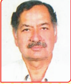
केवल सोनी उपाध्यक्ष