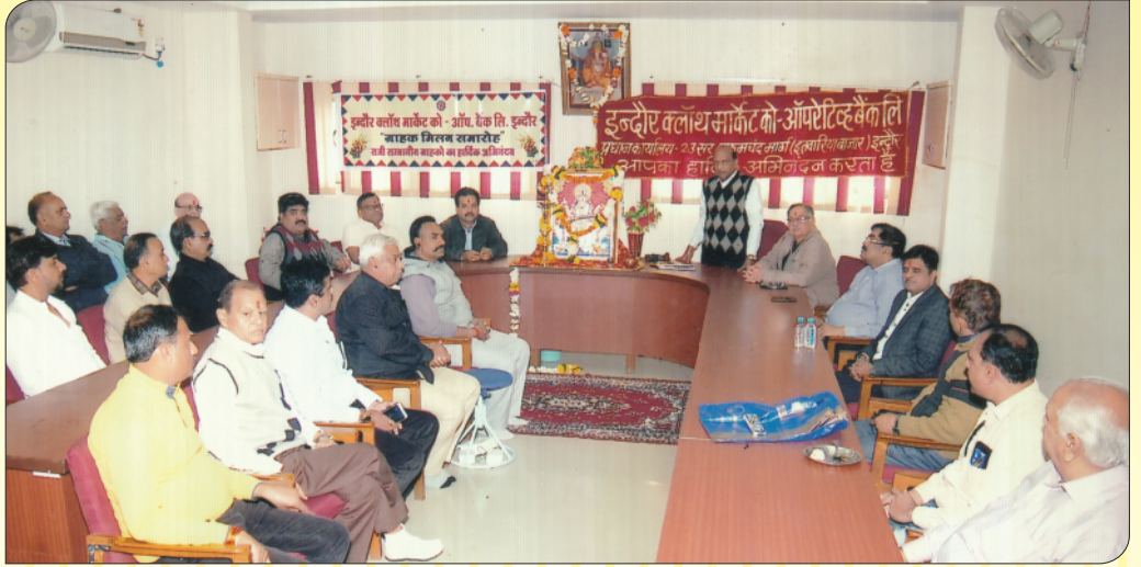
बैंक में ग्राहक मिलन समारोह के अवसर पर उपस्थित अध्यक्ष, उपाध्यक्ष, संचालकगण एवं सम्माननीय ग्राहकगण