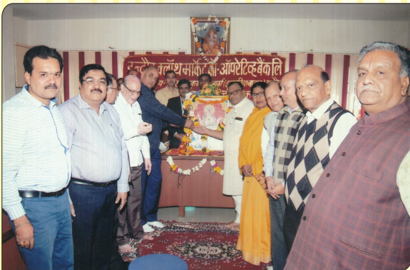
बैंक के स्थापना दिवस पर दीप प्रज्ज्वलित करते हुए अध्यक्ष, उपाध्यक्ष, संचालकगण एवं कर्मचारी